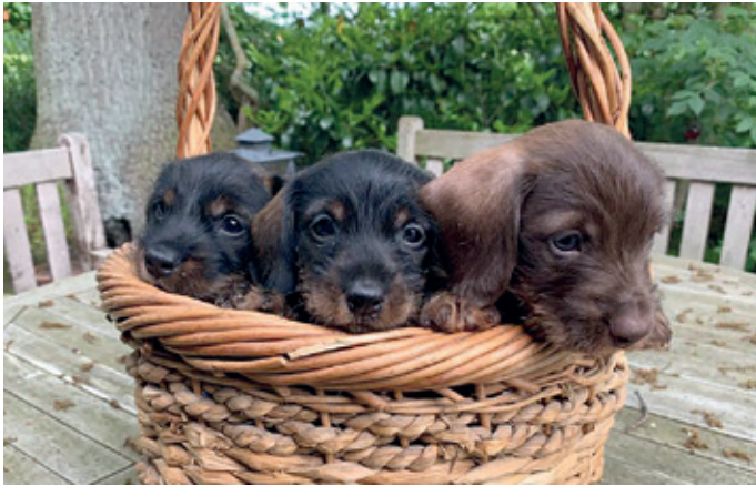
Bienchen, Eddy und Butch vom Schäferhof